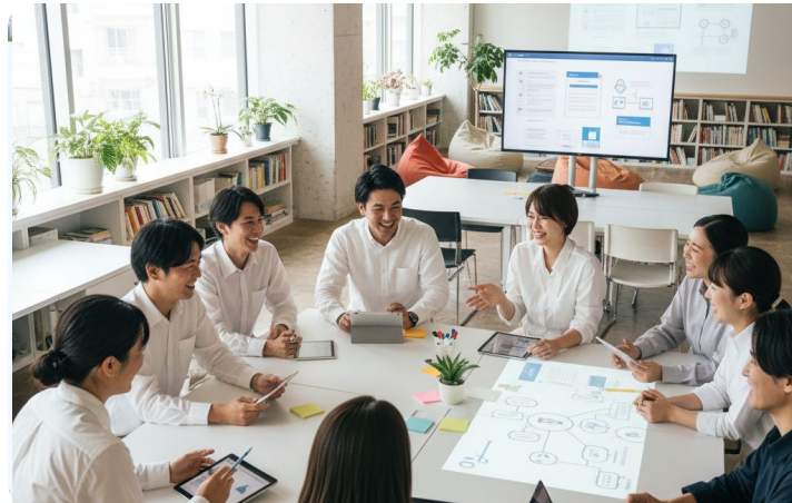
ドキュメント・資料作成 (Notion, Gamma, イルシル 等)