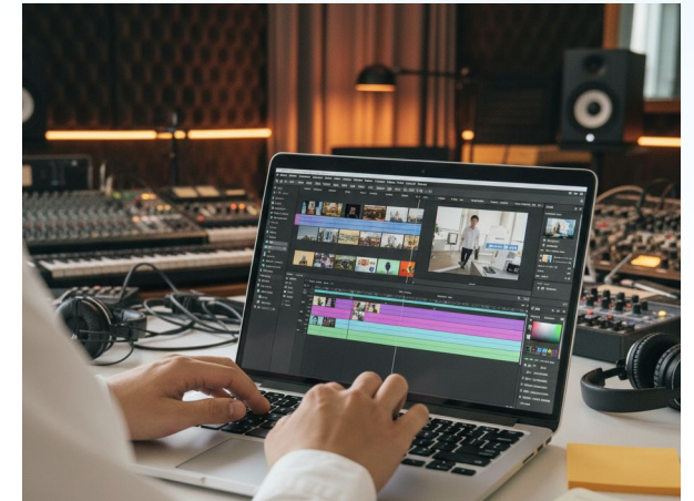
ビジュアル・動画制作 (Canva, ImageFX, NoLang 等)