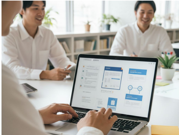
AIチャット・分析 (ChatGPT, Perplexity 等)